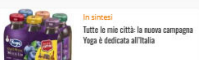
In sintesi Tutte le mie città: la nuova campagna Yoga è dedicata all'Italia