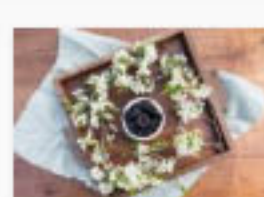
In sintesi Il California prune board punta su innovazione e sostenibilità